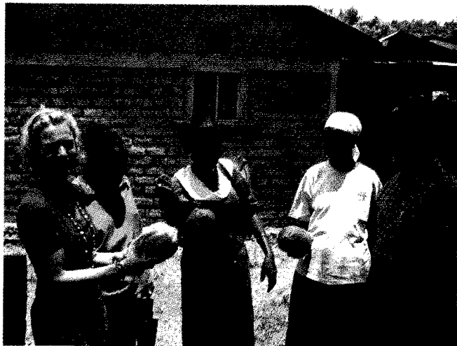
'Verkoop van fruit in het dorpje Gawu. Ik praat met de dames en stimuleer de verkoop'